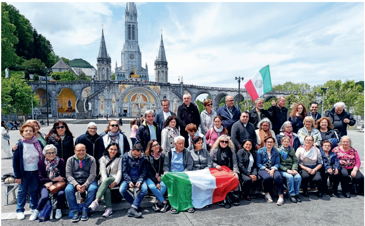
Foto di Gruppo davanti al Santuario

Orari di apertura mattina lunedì-venerdì: 8.30-12.00, pomeriggio solo lunedì: 15.30-17.30