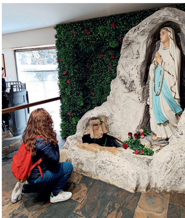
Ave o Maria

templandone nondimeno, con gli occhi del cuore, l'incommensurabile splendore; ho potuto riscontrare quali fossero alcuni dei miei limiti concernenti l'esperienza vissuta, ancor prima di questa straordinaria esperienza; ossia la precaria conoscenza di me stessa, in quanto condizione necessaria di partenza per aprirsi al mondo; mirando, inconfutabilmente, ad un iter di fede incondizionato.