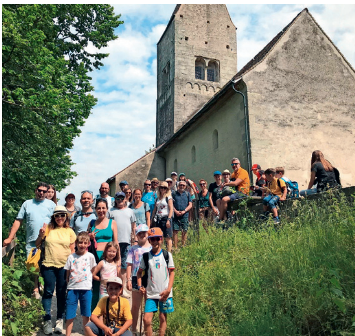
Camminata del gruppo Mamme-papà-bambini all'isola Ufenau

Il mondo di oggi, da una parte sperimenta forme di interconnessione sempre più intense e vaste e dall'altra è immerso in una cultura mercantile che emargina la gratuità. Perciò camminare insieme come battezzati nella diversità dei carismi, delle vocazioni e dei ministeri, così come nello scambio di doni tra le Chiese, è un importante segno di speranza e di solidarietà.