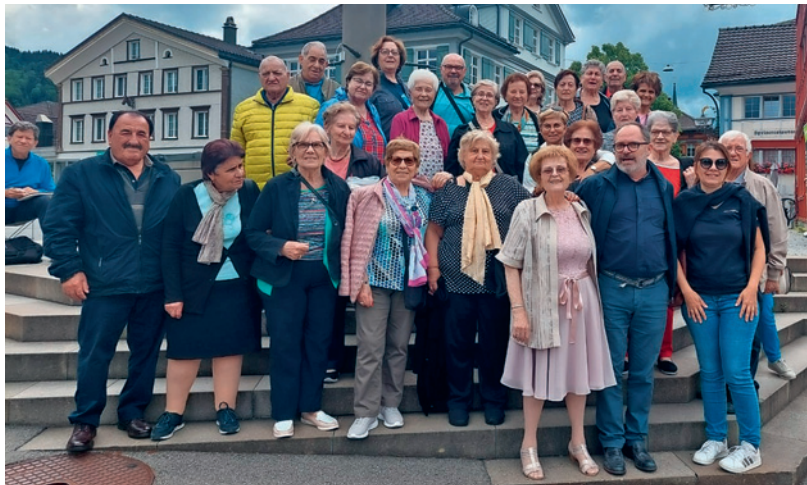
Gita Gruppo Donne e Terza età Uster

Orari di apertura tutte le mattine ore 8.30-12.00, pomeriggio (tranne mercoledì e venerdì) ore 14.30-18.00