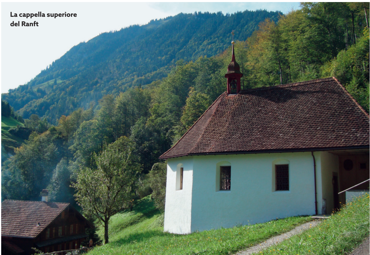
La cappella superiore del Ranft