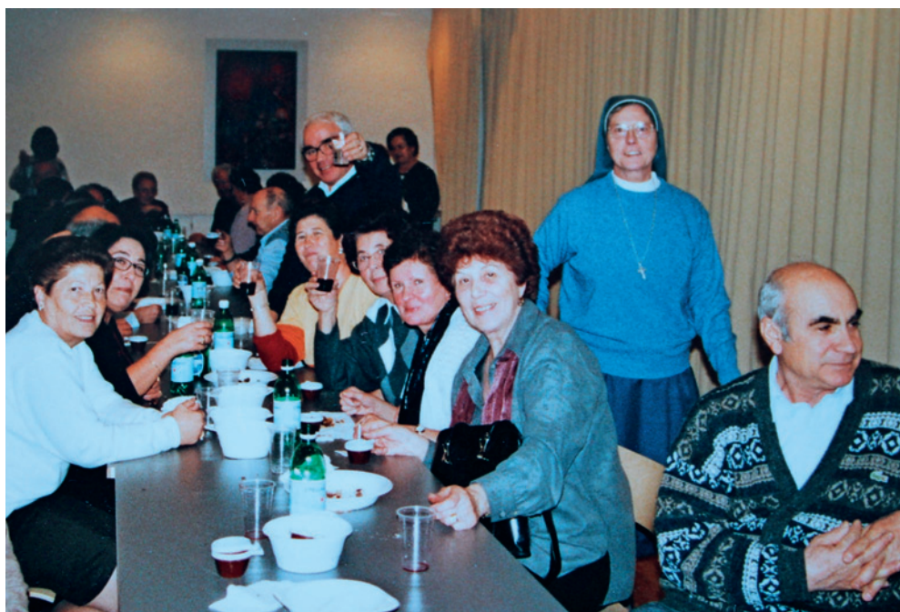
Castagnata comunitaria anni 90