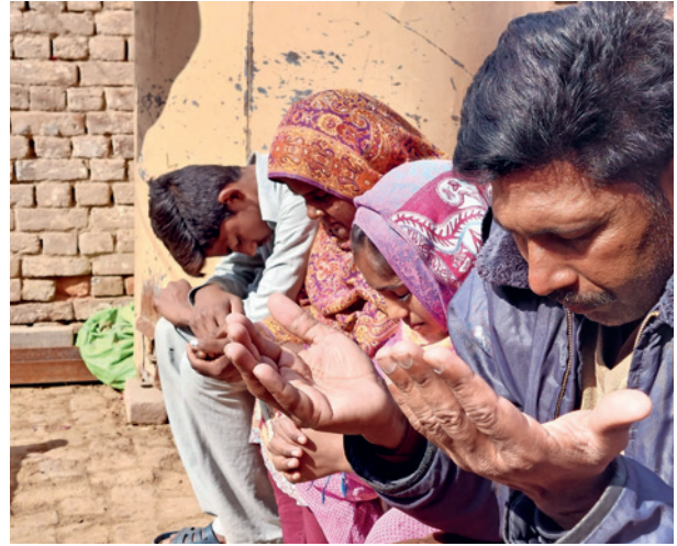
Cristiani in preghiera

Come organizzazione, investiamo molto nel lavoro con avvocati a livello locale e internazionale. Allo stesso tempo, siamo anche un'organizzazione umanitaria che fornisce assistenza diretta alle persone sofferenti, soste-