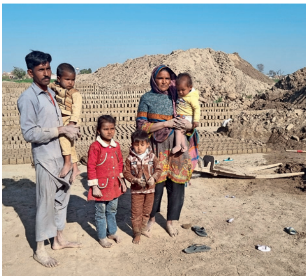
Famiglia nella produzione di mattoni

La legge viene spesso abusata per dispute private, rivalità professionali e persecuzioni religiose. In molti casi basta un semplice sospetto per essere accusati. Se le vittime della blasfemia vengono assolte, molti non sopravvivono; appena lasciano il tribunale vengono uccisi da islamisti. Chi è stato accusato di blasfemia una volta, non potrà mai più vivere una vita sicura, questo vale spesso anche per i familiari e gli avvocati che devono vivere di nascosto. CSI supporta le famiglie spesso povere con le spese legali, ma anche economicamente, poiché per motivi di sicurezza devono spesso cambiare