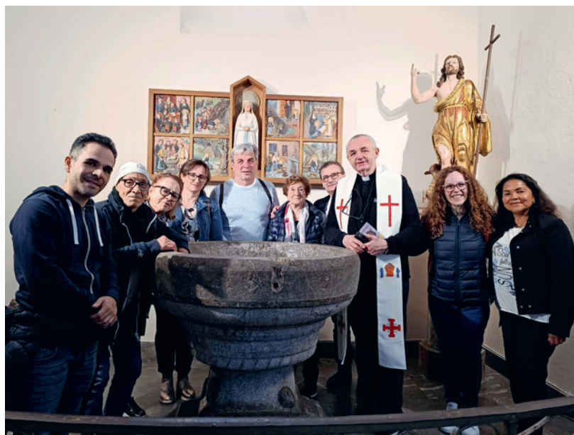
Battistero di Bernadette nella chiesa parrocchiale