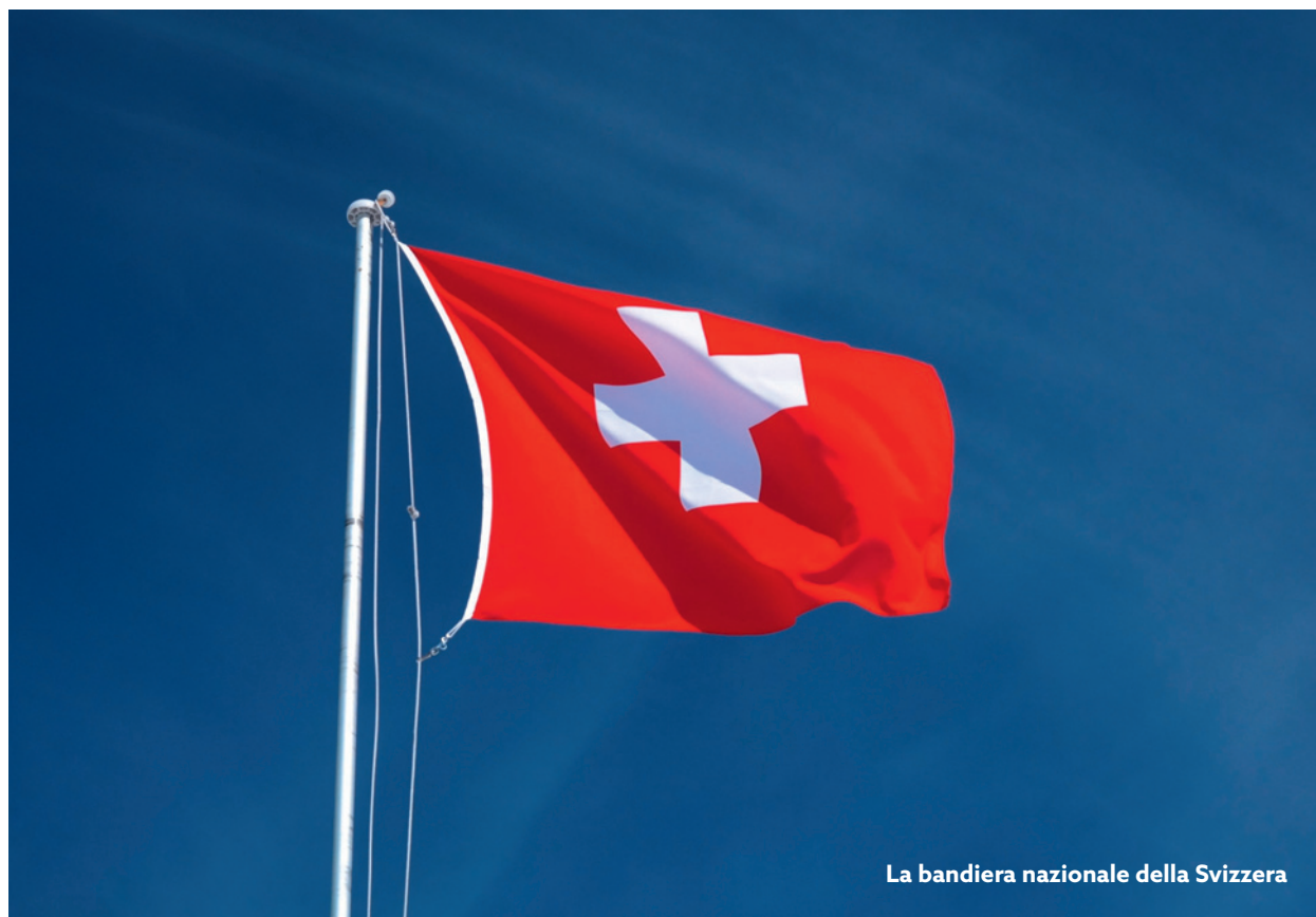
La bandiera nazionale della Svizzera

Fin dall'inizio, praticare il pentimento ed esercitarsi nello spirito di rinuncia facevano parte essenziale della Giornata di preghiera. Al pari di altre festività importanti, era vietato ballare (in alcuni casi fino ad oggi). Le organizzazioni religiose e laiche invocavano la solidarietà nei confronti dei più svantaggiati. La Giornata di penitenza ci vuole ricordare che viviamo in un Paese benestante e quindi dobbiamo essere grati anche per chi ha contribuito a produrre questa ricchezza, ma soprattutto sentirci solidali con i paesi in via di sviluppo. La giornata ci ricorda quanto sia importante sentirci solidali nei con-