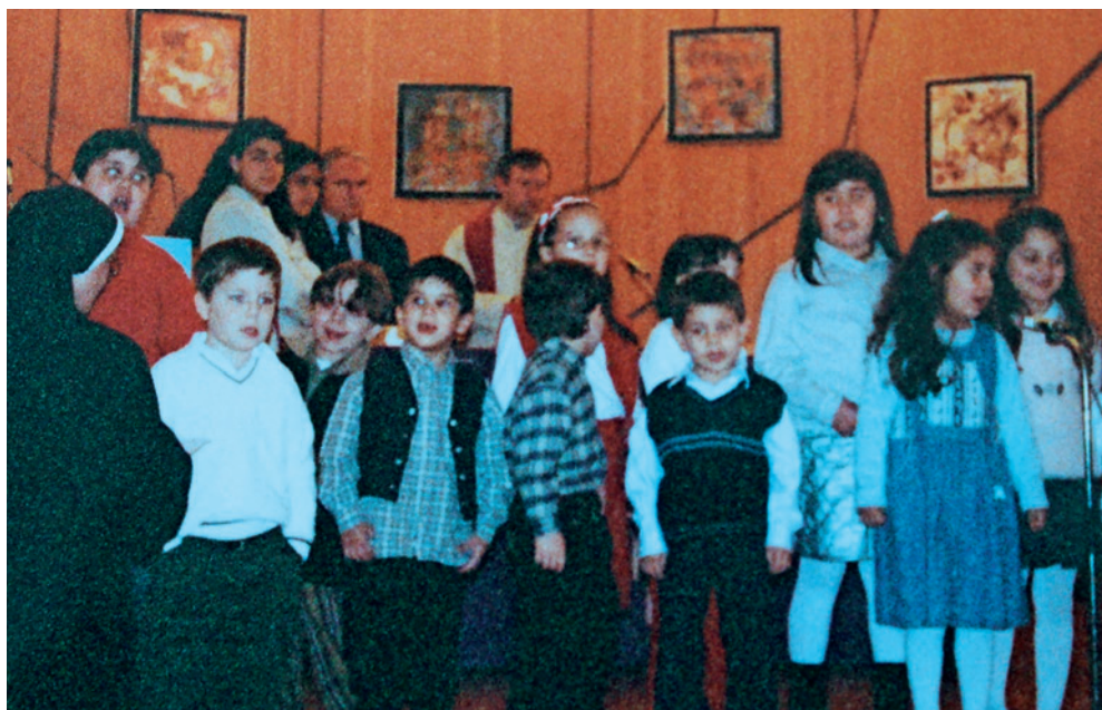
Santa Messa animata dai bambini anni 90