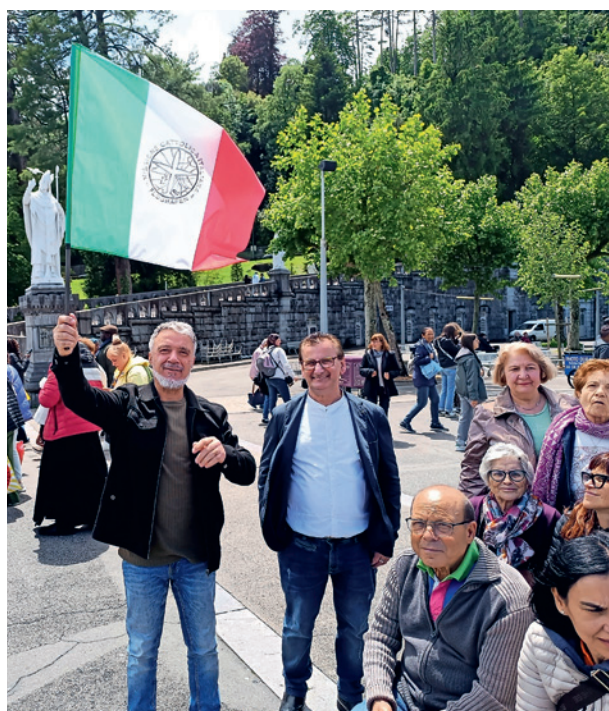
Sorridente mostra la bandiera italiana della Missione