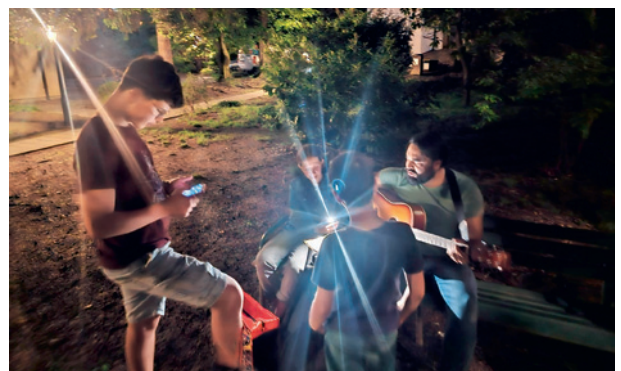
Una serata tra giovani