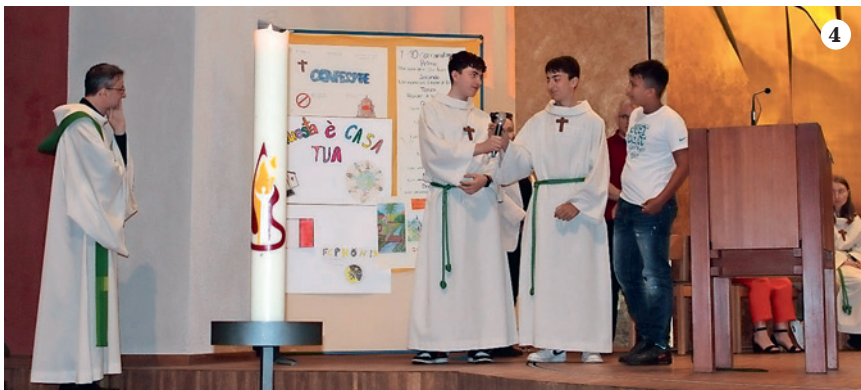
1 Europei di calcio, la gioia prima della disfatta 2 Pranzo mensile adultissimi 3 Cena volontari 4 Oratorio anima la Santa Messa 5 Pellegrinaggio Adultissimi ad Einsiedeln MCLI W'thur+Bülach 6 Santa Messa di Fine Anno Pastorale Immagini: MCLI