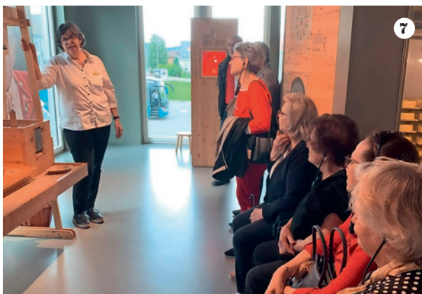
1-3 Processione Sant'Antonio a Egg 4-5 Chiusura mese mariano a Dübendorf 6-7 Visita al caseificio nell'Appenzell con grande interesse da parte dei partecipanti