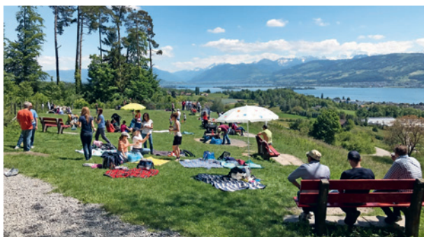
Grigliata del gruppo a Risi (Stäfa)

Dopo le vacanze riprendono incontri del gruppo Mamme-papà-bambini, con una proposta allargata e arricchita. I nostri incontri offrono uno spontaneo spazio, dove le mamme, i papà, ma anche i nonni con i loro nipotini possono ritrovarsi per parlare, conoscere gli altri, creare amicizie, approfondire gli argomenti, condividere i propri vissuti concreti ed emotivi, sorseggiando un caffè e offrendo la merenda ai bambini. Ci sono a disposizione vari giochi per i piccini e per i più grandi. Si può venire spontaneamente a qualsiasi singolo incontro, senza preavviso e senza impegno. Organizziamo vari eventi, come pellegrinaggi, gite, grigliate e uscite al cinema. Confezioniamo vari lavoretti fatti a mano dai bambini, dedicati alle feste più importanti e significative come Natale, Pasqua, Festa della mamma e Festa del papà.