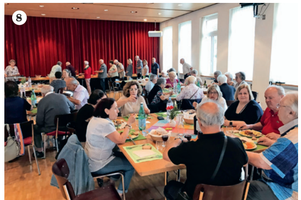
1 Incontro di preghiera a Rüti-Tann 2 Festa della mamma a Stäfa 3 e 4 S. Messa a Hombrechtikon 5 e 6 Giubileo del gruppo pensionati a Stäfa 7 e 8 Grigliata a Rüti-Tann