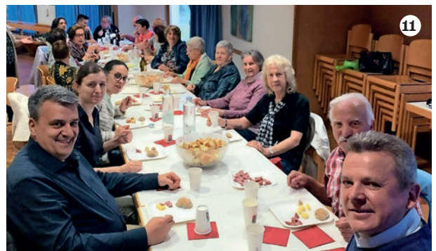
1 Gita a Mainau, Limmattal 2 Cresime adulti, St. Agatha 3 Corale San Giuseppe, 50° giubileo 4 Pellegrinaggio ad Ingenbohl 5 Gruppo donne e simpatizzanti, Dietikon 6 Festa Mamma, Schlieren 7/8/9 Festa della mamma Obfelden 10 Gita Mainau, Affoltern a. A. 11 Corpus Domini, Schlieren 12 Obfelden