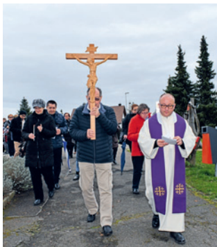
Inizio Via Crucis