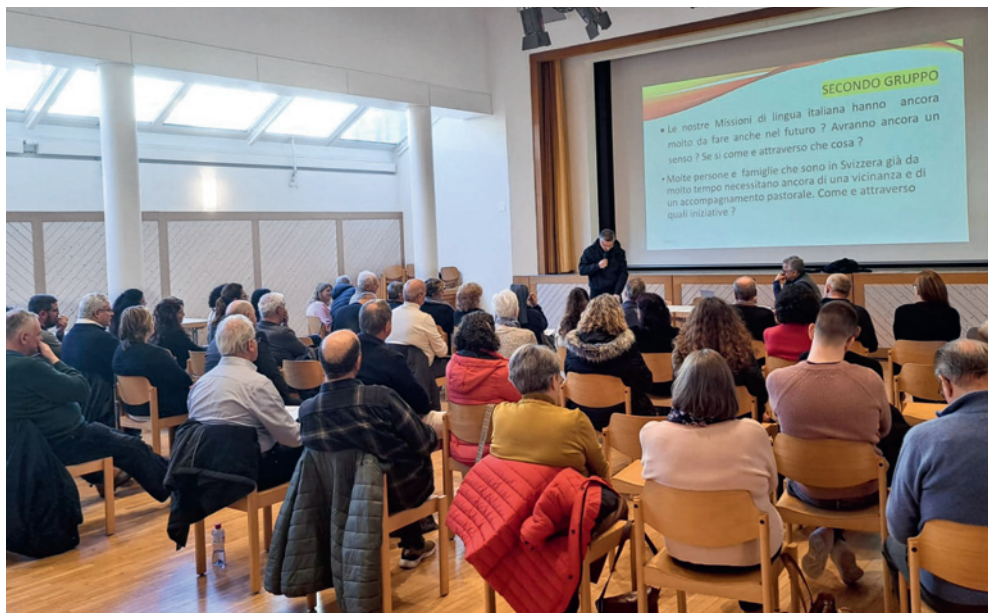
Giornata di aggiornamento