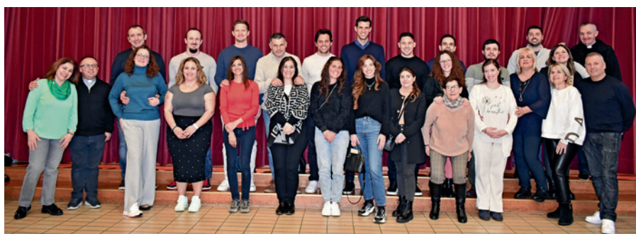
Chiusura del Corso Prematrimoniale 2024