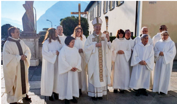
Immagine: M. Terlizzi