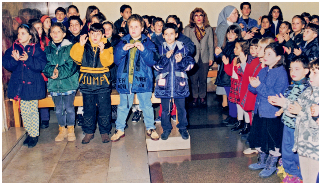
Bambini durante una S. Messa festiva del centenario