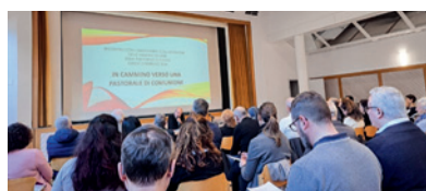
Giornata di aggiornamento Don Bosco, Zurigo

Incontro delle Missioni Italiane 3.2.2024