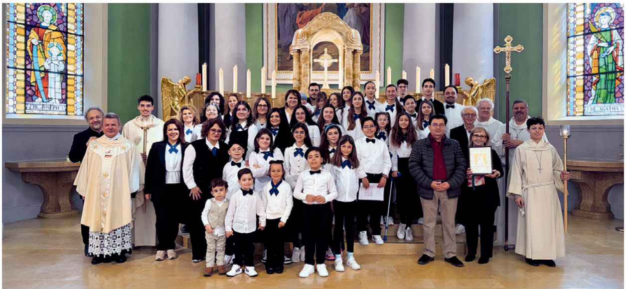
Messa di Pasqua con Coro Voci Bianche, St. Agatha, Dietikon