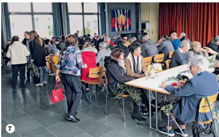
1 Carnevale della terza età a Rüti-Tann 2 Carnevale delle giovani famiglie a Rüti-Tann 3 La S. Messa delle Palme a Wald 4 L'incontro del gruppo Mammepapà-bambini 5 Domenica delle Palme a Rüti-Tann 6 Domenica delle Palme a Stäfa 7 L'aperitivo dopo la S. Messa delle Palme a Stäfa