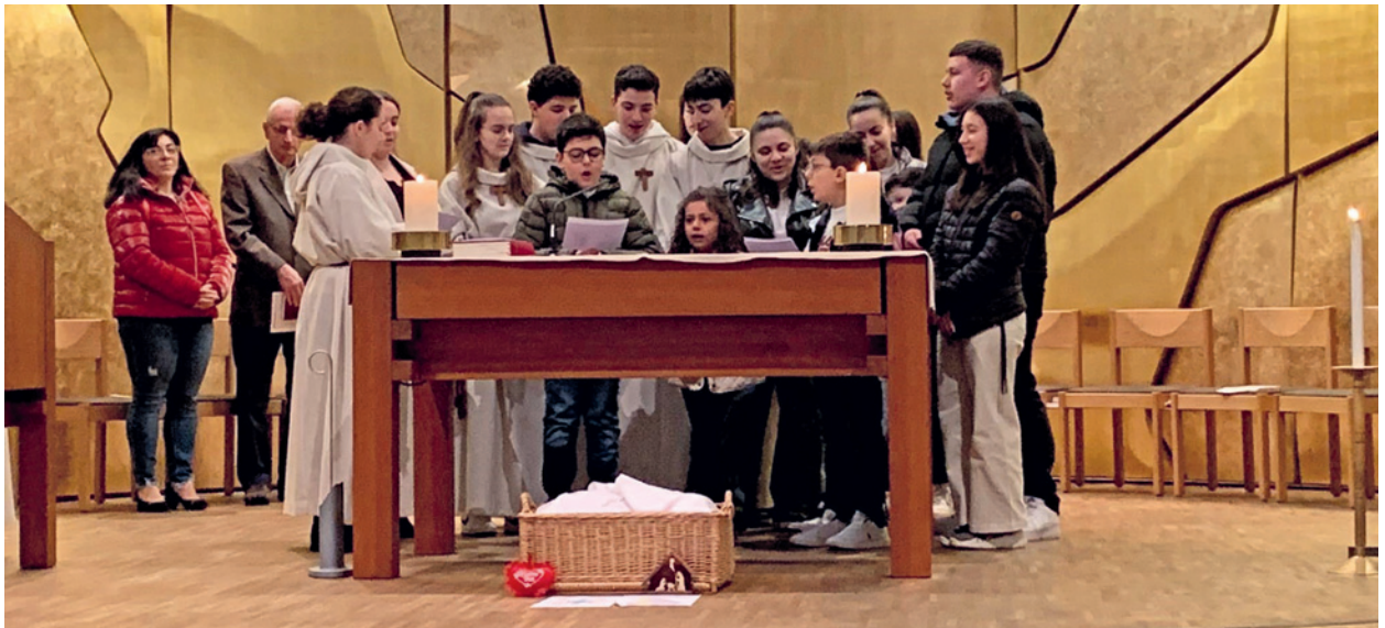
Immagine: A. Camputaro