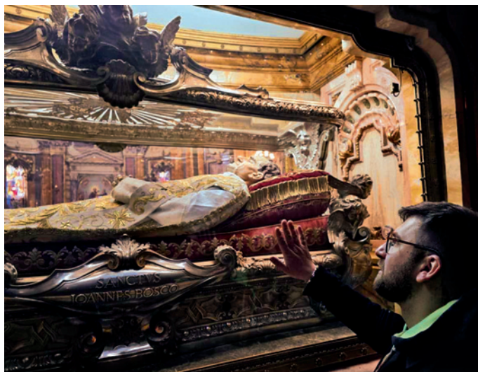
Urna don Bosco

In questi giorni di bellissima esperienza non solo ho potuto respirare l'unicità di una Chiesa che cerca di esprimersi nel mondo alla luce del Vangelo ma ho potuto percepire come la spiritualità di don Bosco possa rendere ancor più possibile, palpabile l'Evangelo di Cristo in tutti gli ambiti della vita pastorale. Da qui il mio impegno concreto, quale operatore salesiano, di non far morire il sogno di don Bosco a Valdocco. Valdocco deve piuttosto diventare il mio punto di partenza dove Vangelo e missione si incontrano in un preludio di amore verso tutti i fratelli che incontriamo nel nostro cammino. Da questa esperienza, dunque, la certezza di dover continuare a sognare come don Bosco ha sognato e desiderato, atti-