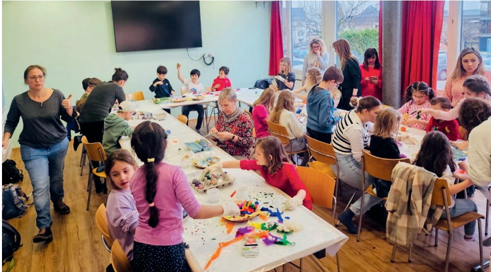
Incontro del gruppo «Mamme e bambini» prima di Pasqua