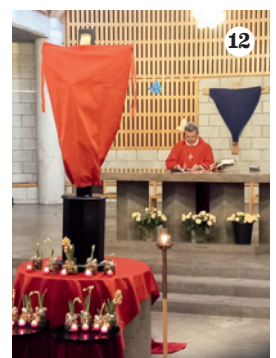
1 Passione vivente 2 Ministranti 3 Festa della donna 4 Decorazione uova, Schlieren 5 Preparazione ulivi, Dietikon 6 Preparazioni ulivi Affoltern a. A. 7 Messa coena Domini 8 Incontro interattivo 9 Gruppo Aquiloni 10/11 Carnevale Obfelden 12 Via Crucis