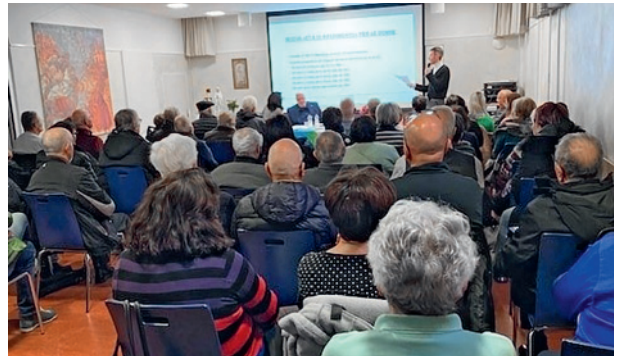
Immagine: G. Ticchio