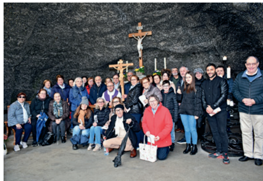
Gruppo dei partecipanti