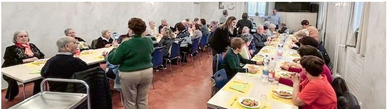
Immagine: Don Luca